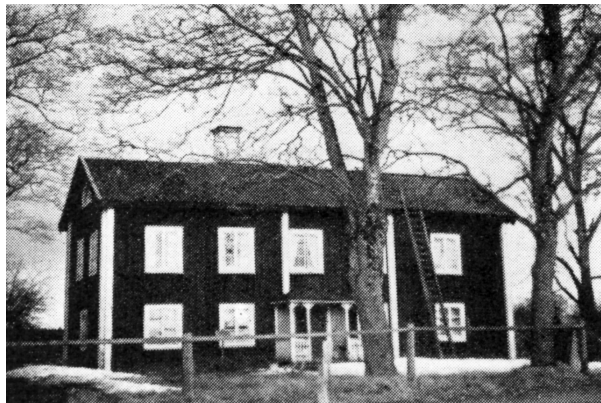
Ollarsgården före 1940.

Vilka har ägt Ollarsgården i Olsbenning, Karbenning socken, och hur har den förvärvats? Svaret på denna fråga kompliceras av en rad uppdelningar och sammanslagningar under årens lopp.